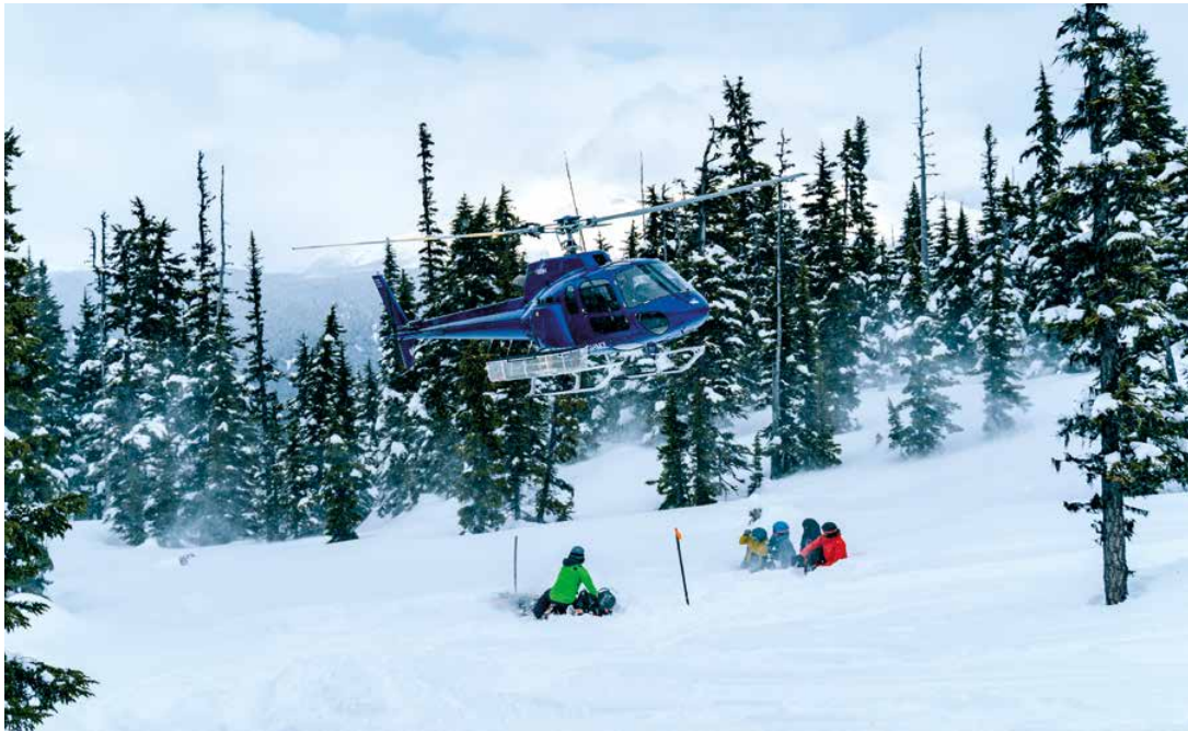
OBE: Wenn der Heli im Anflug ist, heißt es: Köpfe einziehen und in Kauerstellung gehen.

Die Heli-Guides tragen enorm viel Verantwortung, denn Sicherheit steht bei WWH an allererster Stelle.