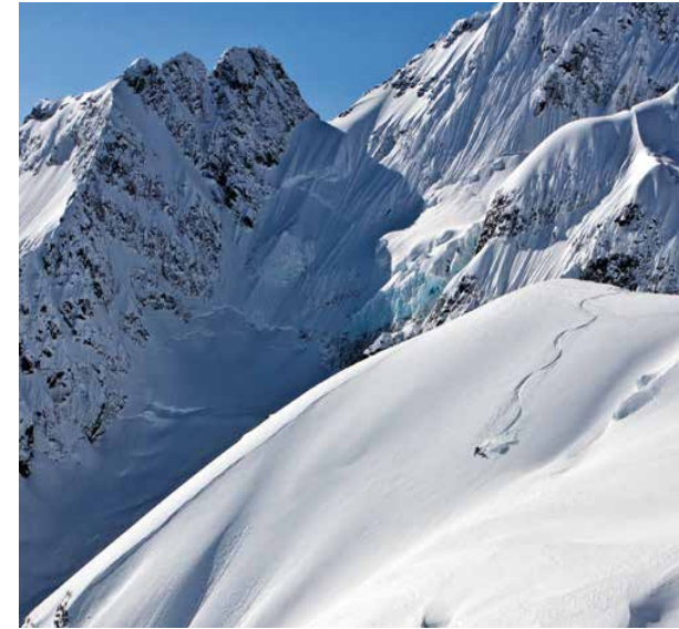
OBE: Blauer Himmel und Pulverschnee ohne Ende, Tage wie dieser sind der Traum aller Heliski-Fans.

Am nächsten Morgen hängen tiefe Wolken über dem Tal des Skeena River. Während die meisten Gäste noch schlafen und einige Eifrigie die Stretch-Class besuchen, sitzen die Heli-Guides zur Lagebesprechung zusammen. Wer dort einmal „Mäuschen“ spielt, merkt schnell, dass es großer Blödsinn ist, den Jungs (und wenigen Mädels) zu erzählen, dass es doch keine harte Arbeit sei, sich jeden Tag aufs Neue im besten Powder des Planeten austoben zu dürfen. Sie tragen enorm viel