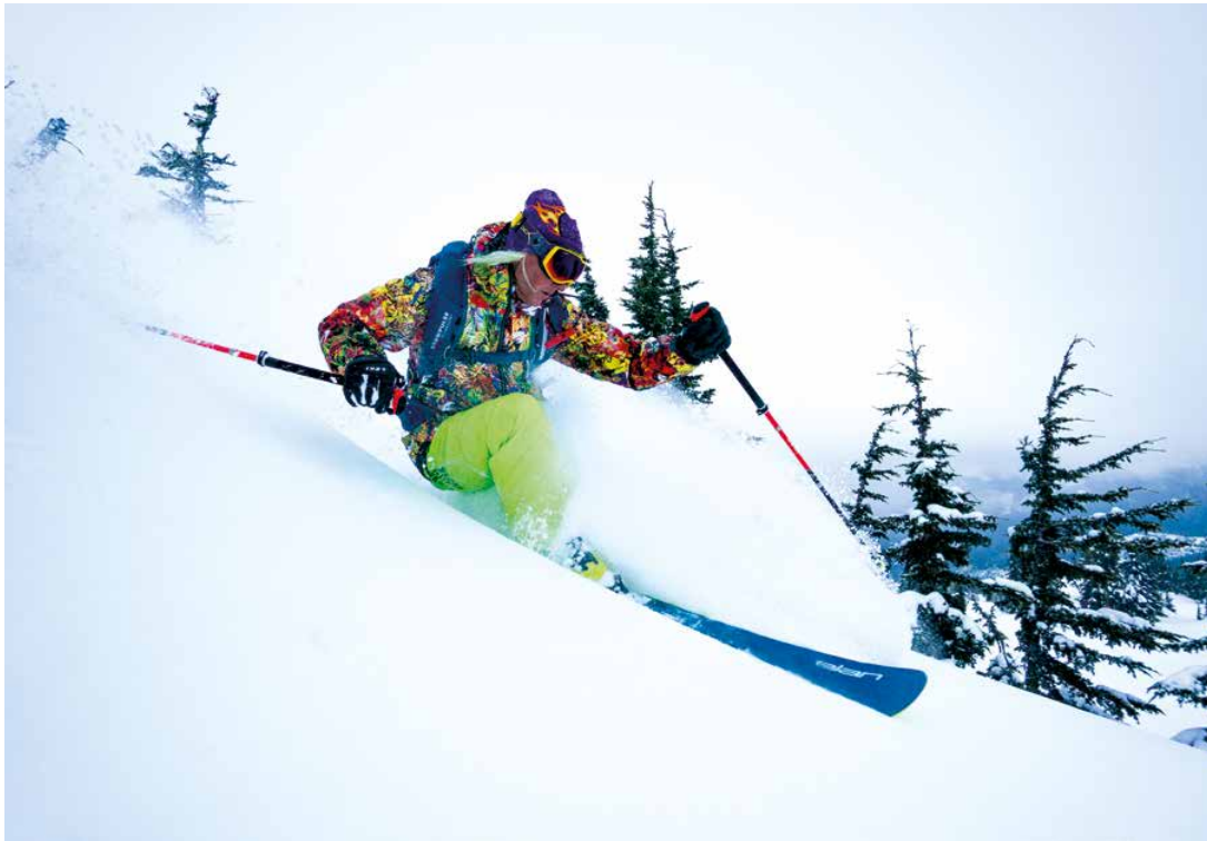
OBEIN: Glen Plake gibt Gas: der Pionier des Extremskifahrens und Elan-Markenbotschafter liebt das Revier von WWH.

Weiter unten im Wald trennt sich die Spreu vom Weizen, trennen sich gute von sehr guten Skifahrern. Eliel, der im Osten Kanadas aufwuchs und dort an Freestyle-Wettbewerben teilnahm, mag es gerne steil. Selbst im 40-Grad-Gelände fährt er stets in Falllinie, nimmt jeden Jump über Felsklippen mit und lässt die Bäume wie Stalomstangen stehen. Ganz ungefährlich ist „Tree Skiing“ nicht. Es lauern „Tree Holes“: Wer kopfüber in einem solchen Loch landet, das sich rund um den Stamm bildet und manchmal mehrere Meter tief ist, kann im grundlosen Triebschnee ersticken, wenn niemand zeitnah zu Hilfe kommt. Im Wald wird deshalb immer in Zweiergruppen gefahren,