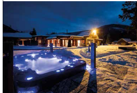
Die Superlative enden bei WWH nicht nach der Pisten-Session. Eine Wellness-Oase gibt es on top.