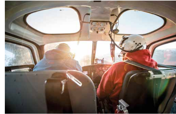
OBEIN: Pilot und Guide stimmen sich eng ab, um die besten und sichersten Runs zu finden.

Das ist jedoch nur eines der Asse von WWH. Das zweite ist die Nähe zur Kleinstadt Terrace, die man von Vancouver aus in nur eineinhalb Flugstunden erreicht. Von dort ist es weniger als eine halbe Stunde zur Lodge, während man bei der Konkurrenz oft zwei Tage in Shuttle-Bussen für die An- und Abreise verliert. Trumpf Nummer drei ist die Lodge selbst. Die liegt zwar am Fluss im Tal, wo man nicht immer eine geschlossene Schneedecke findet, und auch nahe des Highways, was das Wildnis-Feeling etwas beeinträchtigt.